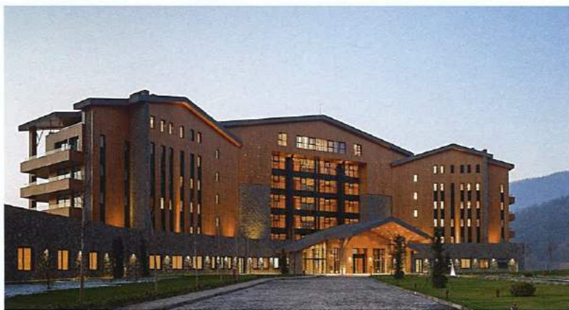
Chenot Palace в Габале проектировал французский архитектор Мишель Жуанне: все номера, бассейн и лобби – с видом на озеро Нохур и горы